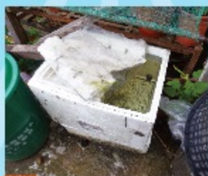
03 保麗龍盒、紙盒、餅乾盒