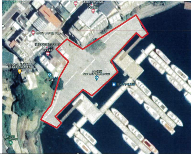
日月潭水社碼頭禁止吸菸範圍