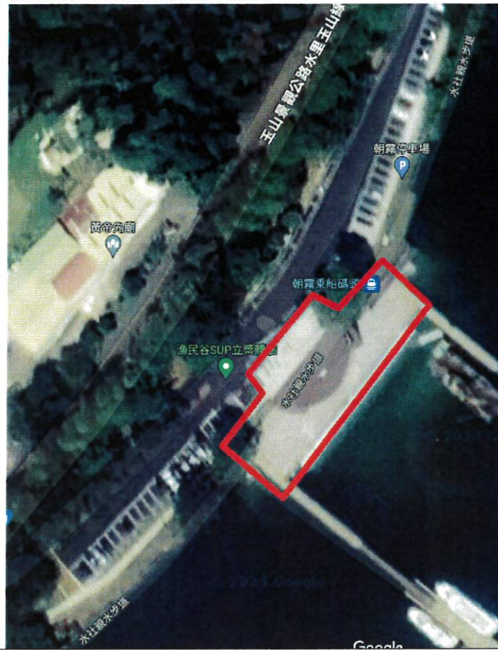
朝霧碼頭禁止吸菸範圍